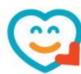
MÉR LÍÐUR VEL

Nálgast má Menntastefnu Reykjanesbæjar á slóðinni: