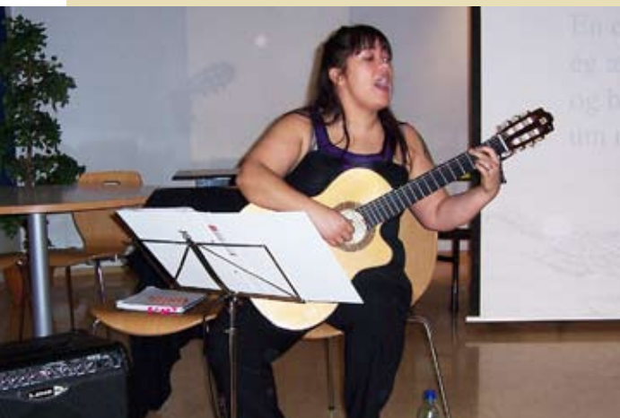
Díana tónlistarkennari stýrir samsöngnum skemmtilega.

Við viljum þakka nemendum fyrir góð ráð og ábendingar og munu kennarar nýta sér þessar mikilvægu upplýsingar við framvindu þróunarstarfsins.