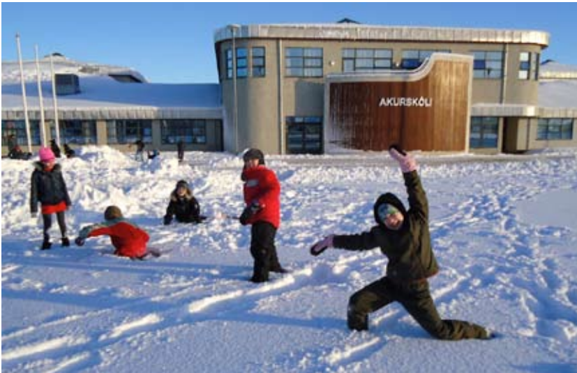
Vetrarfjör í Akurskóla