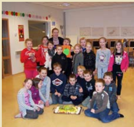
Fölöld í 2.-3. bekk