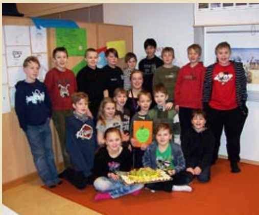
Háhyrningar í 4.-5. bekk

Þessir þrír bekkir voru öðrum til fyrirmyndar í moltugerðinni