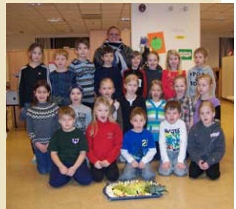
Kálfar í 2.-3. bekk.