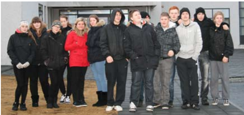
10. bekkur í Akurskóla skellti sér í útskriftarferð í Skagafjörðinn. Flottur hópur.

Eftir morgunverðinn förum við að huga að heimferð og frágangi í sumarhúsunum en áður en við kveðjum Skagafjörð litum við heiminn í hressilegum litboltaleik á Vindheimamelum. Um hádegisbil kveðjum við Skagafjörð og höldum heim á leið á vit nýrra ævinrýa.