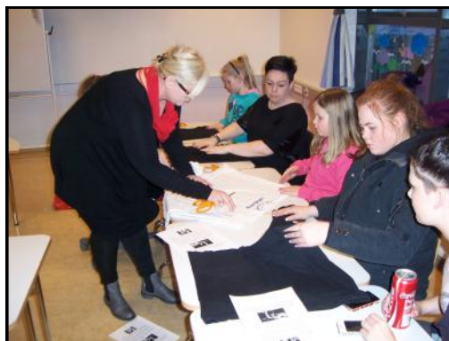
Myndir frá Ég og þú, þú og ég

Foreldrafélagið vil þakka foreldrum fyrir samstarfið þetta skólaár og við hlökkum til þess næsta. Gleðilegt sumar.